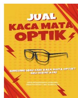
Output Pamflet Promosi Online