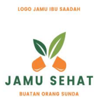
Output logo usaha