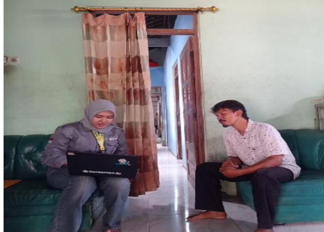
Gambar 3. Selesai Pembuatan NIB

pemerintah bahwa pendaftaran sertifikasi halal tanpa biaya untuk para pelaku UMKM mikro kecil dari tahun 2022-2026. Dalam survei ini memastikan bahan-bahan yang dipakai, penilaian kelayakan produk dan proses produksi lalu mendaftarkan usaha pada website Si Halal . Untuk proses selanjutnya dilanjutkan oleh Lembaga Pemeriksa Halal (LPH) dari UMS.