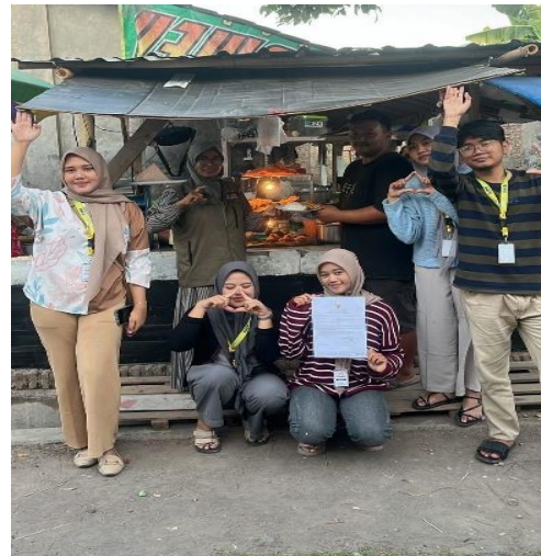
Gambar 4. Selesai Pendaftaran Sertifikasi Halal

Secara keseluruhan, hasil pengabdian menunjukkan bahwa masalah yang dialami oleh usaha kecil dan menengah (UMKM) di Desa Sanggung telah diidentifikasi melalui sosialisasi dan pendampingan yang memberikan pemahaman awal kepada mereka, namun perlu ditingkatkan dengan memberikan dukungan untuk pendaftaran NIB dan sertifikasi halal agar UMKM di Desa Sanggung dapat berkembang dengan baik. Ini sejalan dengan penelitian sebelumnya yang menyatakan bahwa sertifikat halal yang dikeluarkan oleh Majelis Ulama Indonesia (MUI) memberikan jaminan kepada konsumen muslim bahwa produk tersebut aman dan sesuai dengan prinsip agama Islam. Kurangnya pemahaman masyarakat tentang pentingnya NIB dan label halal pada produk mengakibatkan kesulitan dalam memperluas pemasaran yang berdampak pada pendapatan mereka. Penelitian sebelumnya menunjukkan bahwa sertifikasi halal