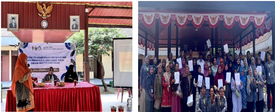
Gambar 2. Kegiatan Sosialisasi NIB dan Sertifikasi Halal

Materi disampaikan dengan terperinci dan mudah dipahami oleh peserta sosialisasi.