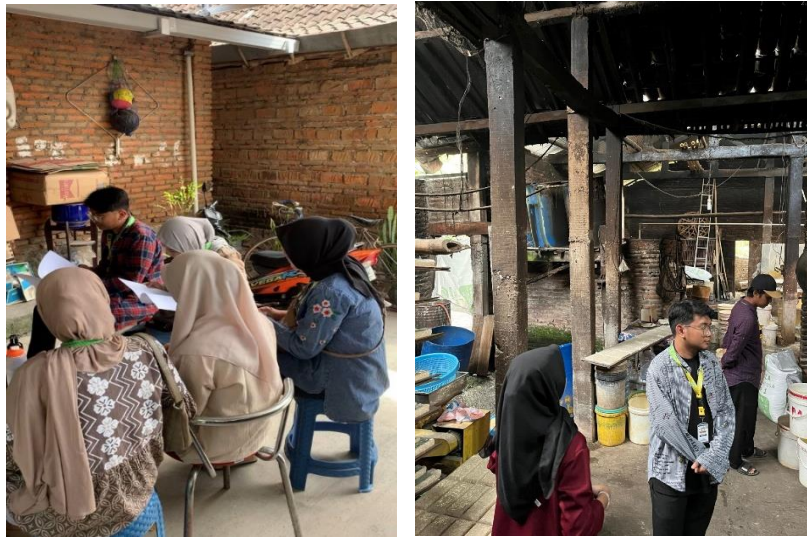
Gambar 1. Survei Lapangan pada UMKM

Setelah melakukan survei dan mengundang pelaku UMKM, selanjutnya dilakukan kegiatan sosialisasi yang dilaksanakan di Kantor Desa Sraten, Kecamatan Gatak, Kabupaten Sukoharjo pada tanggal 22 Agustus 2024. Program sosialisasi dibagi menjadi dua sesi, pada sesi pertama pemaparan mengenai pentingnya Nomor Induk Berusaha (NIB) yang disampaikan pemateri dari Universitas Muhammadiyah Surakarta, yang bertujuan untuk mengenalkan pentingnya NIB untuk jaminan kemajuan usaha mereka dan manfaat yang diperoleh dengan adanya NIB bagi Pelaku UMKM. Pemateri juga menyampaikan bahwa syarat pengajuan dan cara mendapatkan NIB di OSS sebagai berikut: